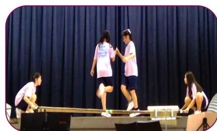
1年2組 フィリピンの伝統的な遊びであるバンブーダンスリズムに乗ったステップで魅せるダンスがかっこよかったです。

中学生と保護者の合計約520名の参加がありました。とても多くの子が体育館で真剣に話を聞いてくれました。ステージ発表やクラス企画も楽しんでもらえて良かったです。