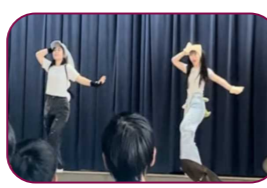
BiBiGo 2人組によるとても可愛いパフォーマンスでした。まさにOMG!!