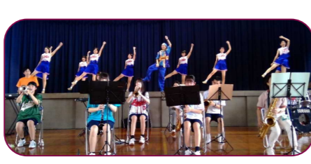
吹奏楽部 毎年恒例の吹奏楽部と先生たちのコラボ!! 演奏とみなさんの歓声盛り上げ、最高の空間でした。私はジャンボリミッキーがお気に入り!