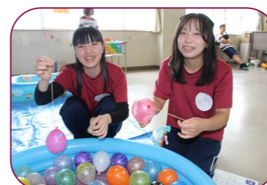
3年E組 本格的な屋台でミニゲームがたくさんあったりヨーヨー釣りでGETできて楽しくて夏祭りの気分でした。