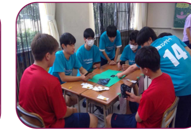
2年2組 ミトベガスでブラックジャックや大富豪をはじめとするカードゲームやダーツなどをおもちゃのお金をかけて楽しみました。