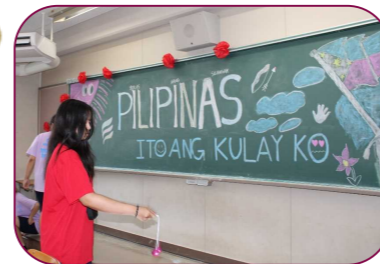
1年1組 アメリカン・クラッカーを体験したり、様々な国の文化の違いをクラス展示で学びました。