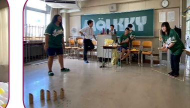
3年2組 初めてモルックをやってみて、上手に倒すことができず難しかったです。頭を使ってピンを倒すことがコツのようです。