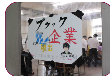
1年4組 ブラック企業からの脱出を目標に謎を解くのが難しかったけど様々なタイプの謎で楽しかったです。