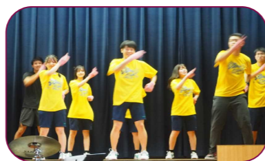
そのちゃんといっしょ♥ 会場が一体となって盛り上がったエピカニクス!! みなさんの楽しく最高の笑顔で踊る姿が印象的でした。