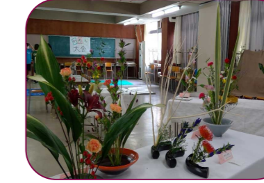
日本文化部 日本文化を感じられる展示でした。生け花だけでなく習字や川柳、かるた大会の開催など日本文化の良さに改めて気づきました。