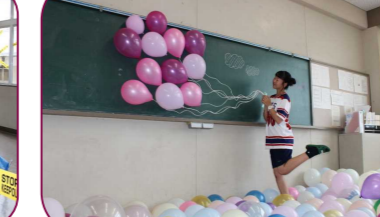
3年1組 たくさんの風船と一緒に写真がとれたり、黒板を使って天使や悪魔の羽をチョークで描いて写真を撮ったりすることができました。