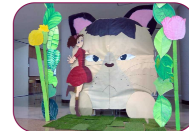
ビジュアルアート ジブリの世界に迷い込むことができる展示でした。アリエッティと猫のミーヤと写真を撮ることができました。