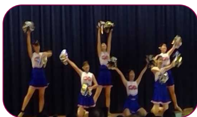
バトン部 1年生から3年生によるチアダンスをはじめ、1・2年の曲調が変わるダンスが印象的でした。