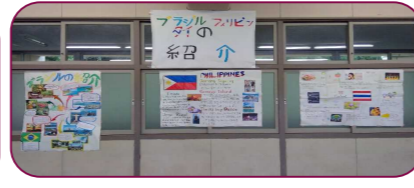
Mito squat 日本と他国の違いについてまとめられたポスターを展示してありました。海外からの日本への視点を知ることができました。