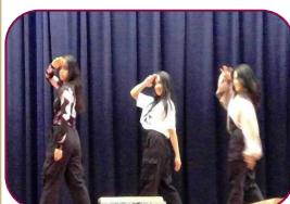
Venus 3人によるセクシーで迫力のあるステージで最高でした。