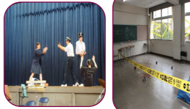
2年E組 ステージではシリアスな雰囲気もありましたが、ところどころにあるコディーがおもしろかったです。クラスでは学校内に潜む犯人を捜しました。