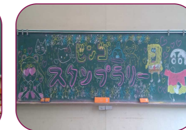
2年1組 スタンプラリービンゴで友達と学校を歩き回りながら楽しい時間を過ごせました。