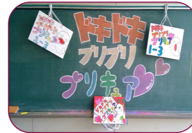
1年3組 学級閉鎖のため残念! プリキア~