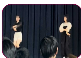
LE SSERA 6人のパートを2人でアレンジし、カッコよく表現していて感動しました。